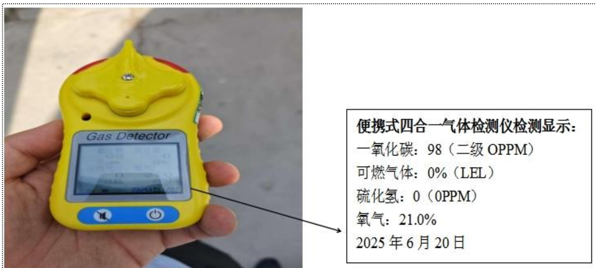
图 3 公司 2 号矿热炉环保车间三层西侧检查口一氧化碳瞬时浓度检测值为 98PPM