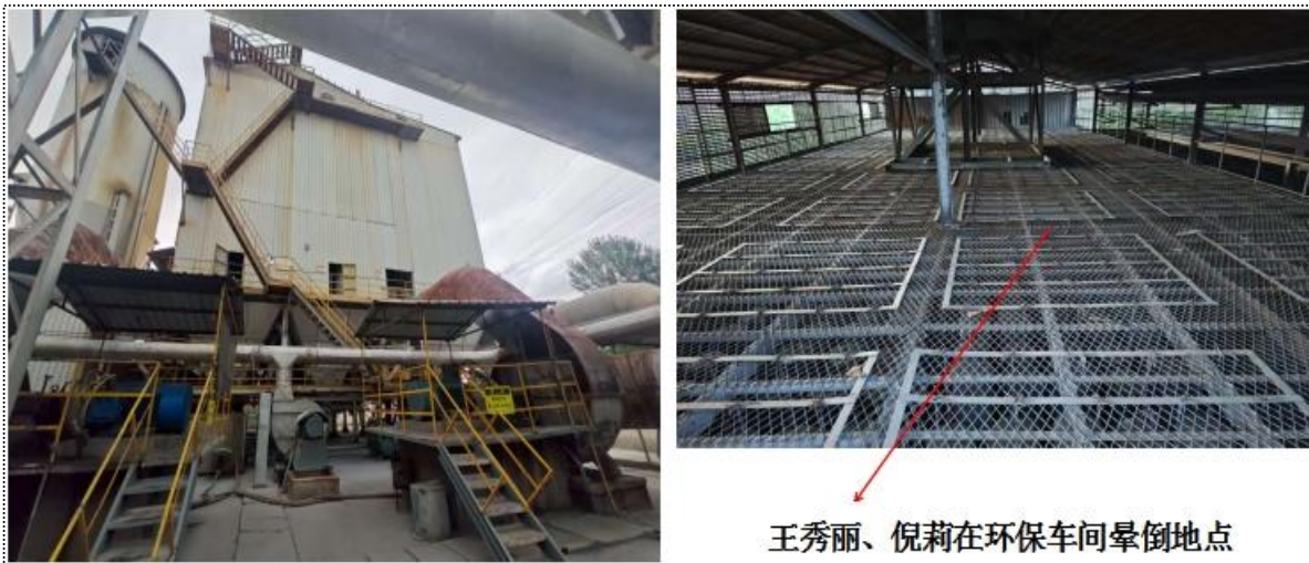
图 2 事故现场照片

此次事故中的受害者位于环保设施三层西侧检查口所连接的环保除尘设施箱体内部，该位置距离检查口约 7 至 8 米。事故发生后，沙坡头区应急管理局执法人员对现场进行气体检测，在 2 号硅铁炉环保设施三层西检查口处测得 CO 瞬时浓度为 98PPM。（标准情况下，CO 安全作业浓度为 24PPM）