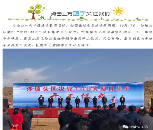
沙坡头区举行“决战100天”项目集中开工仪式 杨子良 沙坡头工信 10月18日